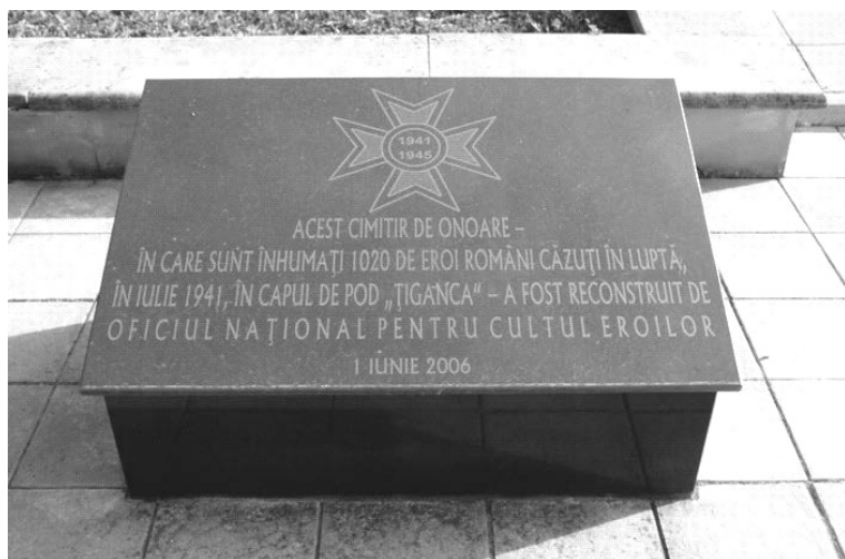
Mormîntul "eroilor" români de lângă satul Țiganca.