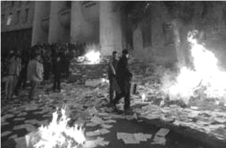
Vandalizarea clădirilor Puterii de Stat de către forțele unioniste (7 aprilie 2009)