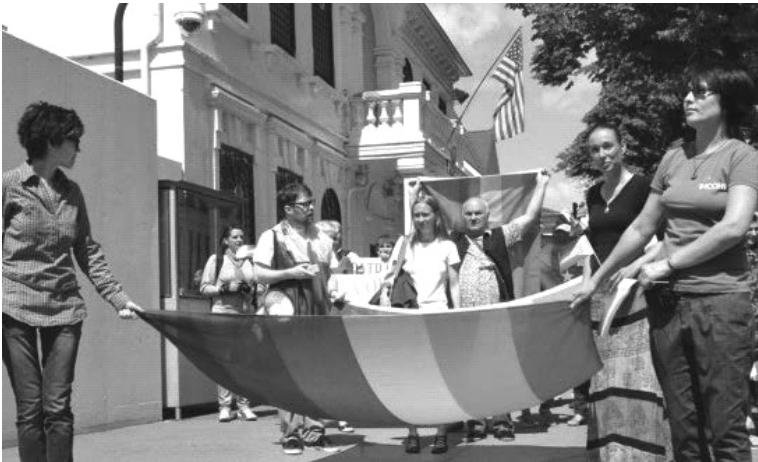
Paradă de minorități sexuale în Chișinău

Fîlfiiau cu steaguri europene, Dar nici umbră din libertățile UE, Numai parade de pederastați și lesbiene, Iar de lozinci frumoase – capu-mi huie!