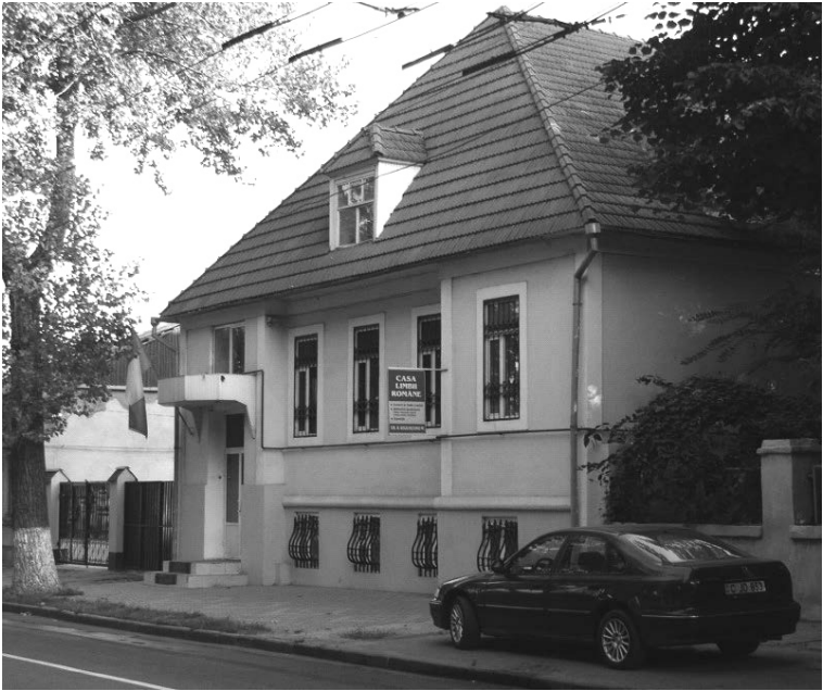
Casa limbii române