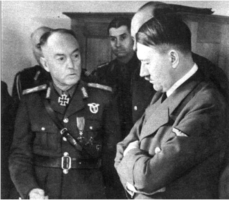
Tratative secrete ale liderilor fasciști Adolf Hitler și Ion Antonescu cu privire la „războiul-fulger” contra URSS.

Setos de slavă și noi pămînturi, Cu Hitler și gorile de peșteră Ai vrut să bagi noroade în mormînturi, Ca sa te faci stăpîn pe Terră!