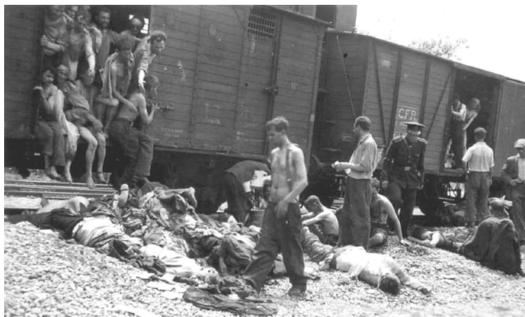
Holocaustul din România