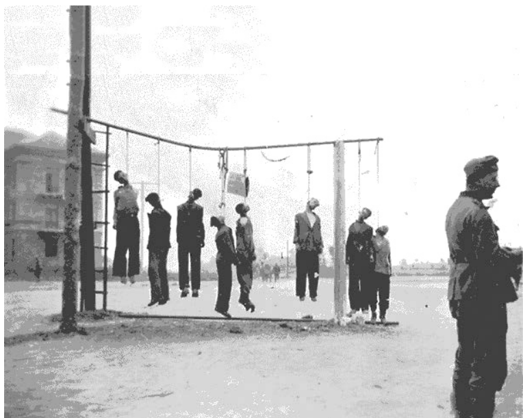
Spânzurători românești în or. Odessa, anul 1941