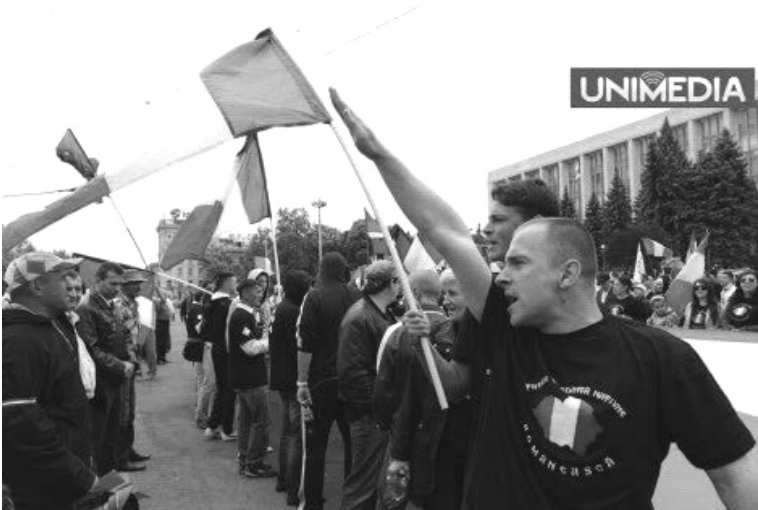
Marșuri legionare în Piața M.A.N