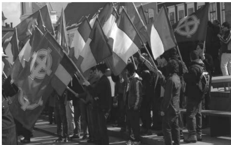
Haite legionare la Chișinău