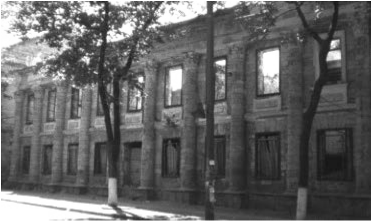
Iar acesta e aspectul monumentelor istorice...